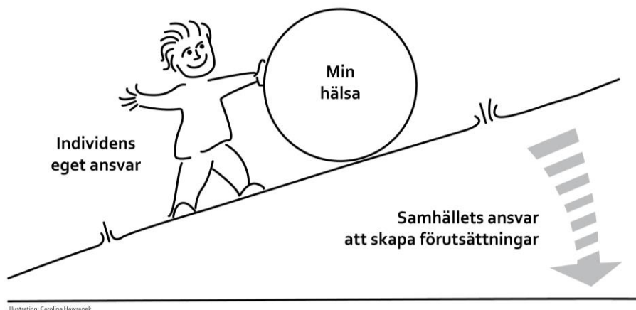
Bild 1: Balans mellan individens och samhällets ansvar för hälsa; Samhället har ansvar för att skapa likvärdiga förutsättningar för alla som underlättar för individen att kunna ta ansvar för sin egen hälsa. Illustration: Carolina Hawranek, Östergötland, 2014.

I bild 1 illustreras att samhället kan bidra till en bättre hälsa för en individ genom att skapa förutsättningar för god hälsa och underlätta för individen att ta hand om och utveckla sin hälsa. I bild 2 illustreras de bestämningsfaktorer för hälsa som finns på både samhällsnivå och individnivå.